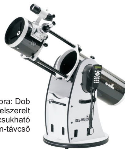
4. ábra: Dob Synscan-nal felszerelt összecsukható dobson-távcső