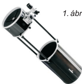
1. ábra: Összecsukható Dobson távcső tubusa

Figyelem: A leírt műveleteket ajánlatos a távcsövet forgalmazó szakemberekkel elvégeztetni. Amennyiben saját maga végzi a felszerelést, különös gonddal járjon el. Sem a műszer gyártója, sem forgalmazója nem vállal garanciát a szakszerűtlen felszerelésből adódható sérülésekért és meghibásodásokért.