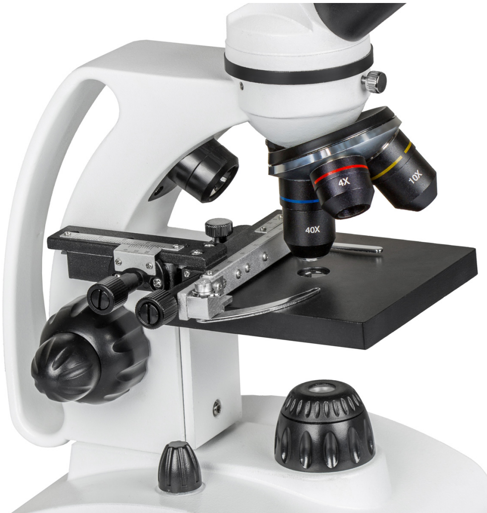
3. ábra: A mikroszkóp tárgyasztala közelebbről, a finommozgató berendezéssel